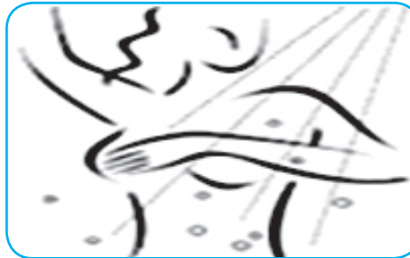
KUR BËNI DUSH