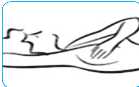
NË POZITËN E SHTRIRË