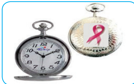
DIAGNOSTIKO NË KOHË