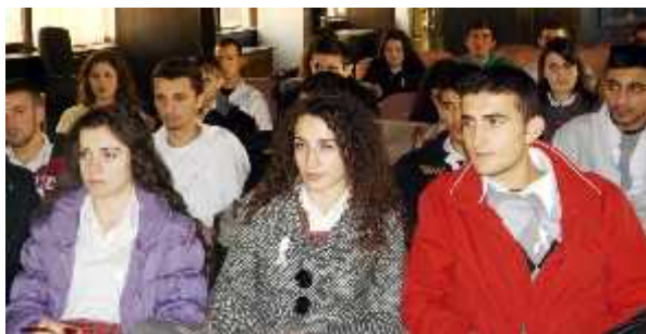
Ligjeratat senzibilizuese me nxënës të shkollave të mesme, Prizren, 2.XII.2013