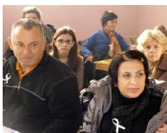
Ligjerata kundër dhunës në familje, 9. XII. 2013, Prizren