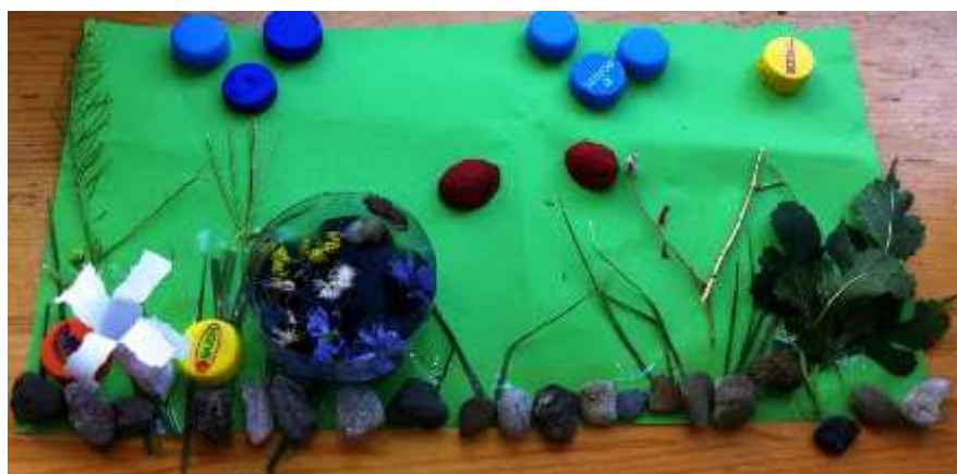
OJQ "Handikos," Qendra e Rehabilitimit e Bazuar në Bashkësi, Prizren