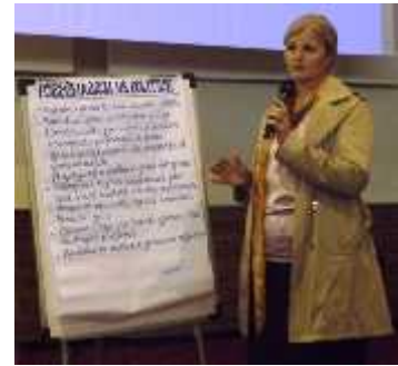
Ceremonia e përmbylljes së Projektit “Forcimi i kapaciteteve të Grupeve të Grave në Kuvendet Komunale të Kosovës” organizuar nga Misioni i OSBE-së në Kosovë, Prishtinë 9.X.2013,