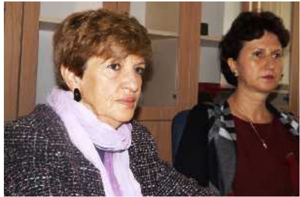
Promovimi i Grupeve Joformale të Grave të disa Komunave të Kosovës, organizuar nga Misioni i OSBE-së në Kosovë, Prishtinë 16.X.2013