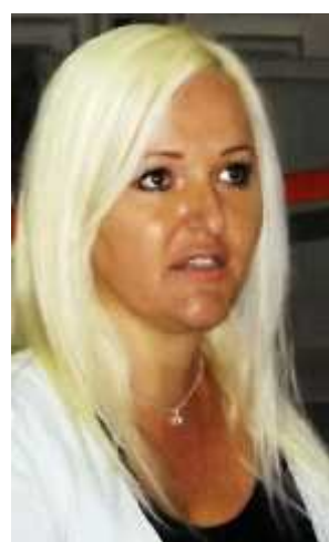
Ekspozita e fotografive të personave me nevoja të veçanta, Organizata e Personave me Distrofi Muskulore e Kosovës /OPDMK/, Qendra në Prizren