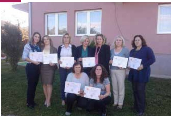
▪ Foto nga projekti “Dizajni në Rrobaqepësi dhe Përkrahja e Grave dhe Vajzave për Punësim në Viset Rurale”

Ngritja e mirëqenies familjare duke u bazuar në punën vetanake dhe nevojat familjare për punësim dhe nevojat bazike ushqimore dhe krijimin e mundësive për ofrimin e një vendi të punës për vetveten dhe familjen si dhe shfrytëzimin e të mirave natyrore në vendin tonë, ka qenë synimi kryesor i “Projektit Intevsiv- Bletari”. Agjencia për Barazi Gjinore ka subvencionuar këtë projekt duke e ndihmuar në rritjen e numrit të bletëve me qëllim të prodhimit të mjaltit cilësor dhe shërues. Me rritjen e numrit të bletarisë dhe prodhimin e mjaltit iu është mundësuar zgjerimi i të ardhurave financiare për familje dhe punësimi i disa grave të fshatit.