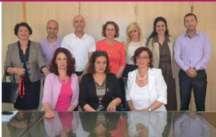
■ Aktiviteti i realizuar nga ZBGJ në Gjakovë

Sqarim: Në këto të dhëna nuk përfshihen postet politike.