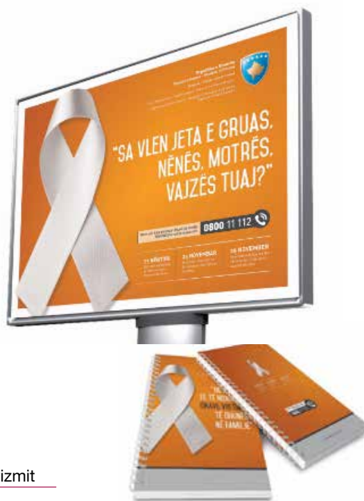
▪ Bilbordat e realizuar për fushatën e 16 Ditëve të Aktivizmit