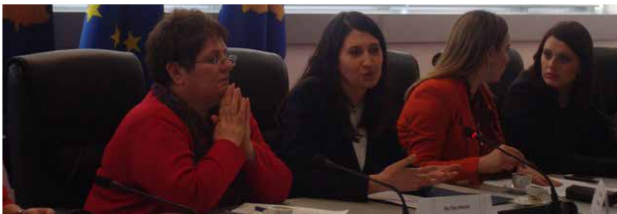
▪ Foto nga prezantimi i hulumtimit “Pjesëmarrja, roli dhe pozita e grave në institucionet qendrore, lokale dhe në partitë politike në Kosovë”

Agjencia për Barazi Gjinore ka realizuar hulumtimin “ Pjesëmarrja, roli dhe pozita e grave në institucionet qendrore, lokale dhe në partitë politike në Kosovë ”. Hulumtimi është realizuar përmes intervistimit të grave dhe vajzave në shërbimin civil dhe në parti politike. Ky hulumtim ka analizuar dhe identifikuar :