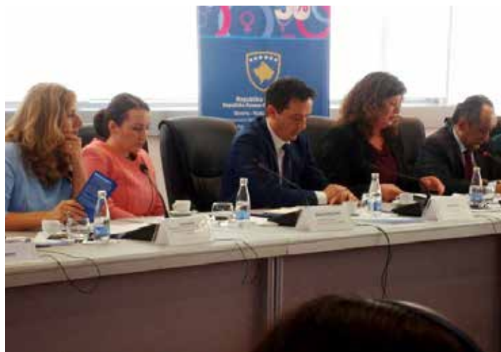
▪ Foto nga promovimi i Ligjit për Barazi Gjinore

Agjencia për Barazi Gjinore në kuadër të Zyrës së Kryeministrit në bashkëpunim me Komisionin për Drejta të Njeriut, Barazi Gjinore, Persona të Pagjetur dhe Peticione, në Kuvendin e Kosovës, kanë organizuar tryezë diskutimi, për promovimin e Ligjit të ri për Barazi Gjinore.