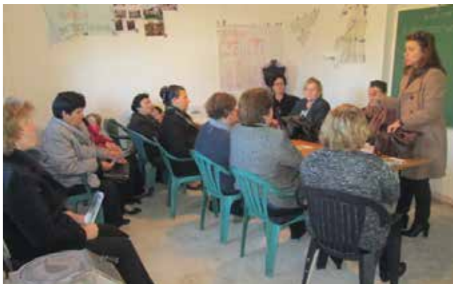
▪ Aktivitetet i realizuar nga ZBGJ në Fushë Kosovë