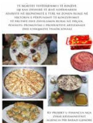
▪ Foto nga projekti “Përpunimi dhe konservimi i frutave dhe zhvillimi i turizmit rural në Komunën e Deçanit”