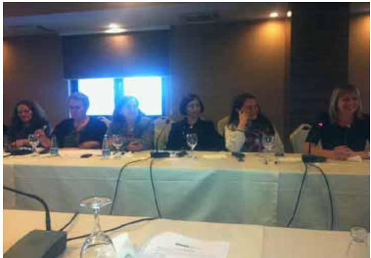
▪ Aktiviteti i realizuar nga ZBGJ në MMP

Zyrtarja për Barazi Gjinore në Qendrën e Studentëve ka raportuar mbi të dhënat e ndara në gjini sa i përket punësimit dhe numrit të studentëve në këtë qendër.