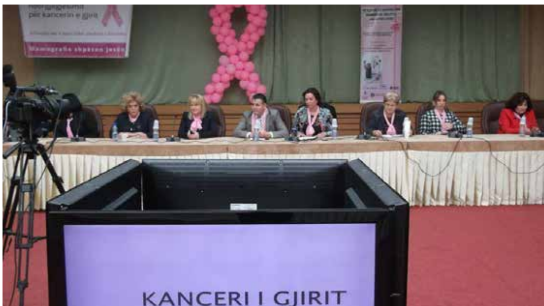
▪ Aktiviteti i realizuar nga ZBGJ në Mitrovicë

Zyrtarja për Barazi Gjinore në Komunën e Mitrovicës përgjatë vitit 2015 ka realizuar një serë aktivitetesh. Duke filluar me shënimin e Ditës Ndërkombëtare të Gruas 8 Marsin, në bashkëpunim me Komitetin për barazi gjinore të Kuvendit të Komunës dhe Grupin e Grave Asambleiste, kanë organizuar në Qendër të Kulturës “Rexhep Mitrovica” shfaqjen e filmit “Engjujt e Hekurt” i cili ka treguar sfidat nëpër të cilat kanë kaluar gratë për të fituar të drejtën e votës. Në kuadër të shënimit të kësaj date janë ndarë 30 mirënjohje për Gratë mësuese veterane të arsimit të ulët fil-lor, të cilat tashmë janë pensionere. Po ashtu, është vizituar OJQ, Zëri i Prindërve, ku janë takuar me 30 gra kryefamil-jare.