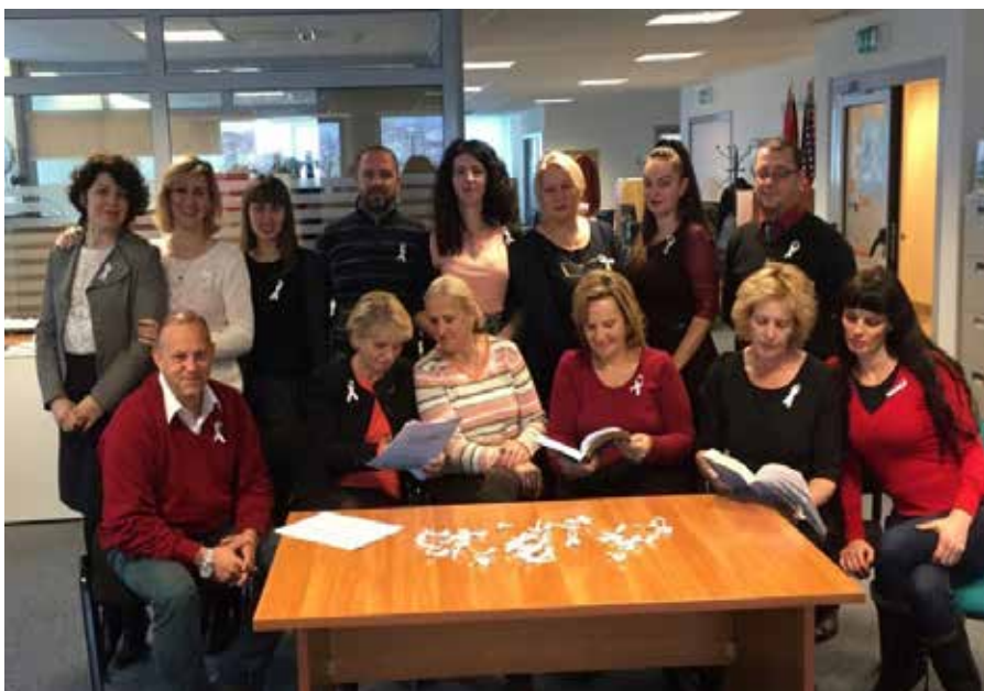
▪ Aktiviteti i realizuar nga ZBGJ në MAPL

Zyrtarja për Barazi Gjinore në Ministrinë e Shëndetësisë ka realizuar aktivitete konfom detyrave dhe përgjegjësi-ve qe ka. Në mbështetje të OSBE-së ka mbajt trajnime për Procedurat Standarde të Veprimit për Mbrojtje nga Dhuna në familje në Kosovë, për profesionistet shëndetësor, se si do te trajtohen rastet e dhunës, regjistrimi i tyre i veçantë dhe si te jenë konfidenciale. Trajnimet janë mbajt në regjionin e Prizrenit, Pejës, Klinë, Istog, Deçan, Gjilan, ku te ftuar kanë qenë stafi mjekësor nga Emergjencia në kuadër te Spitaleve, QKMF-te dhe Qendrat e Shëndetit Mendor në shërbimet shëndetësore dhe janë trajnuar 180 profesionist Shëndetësor.