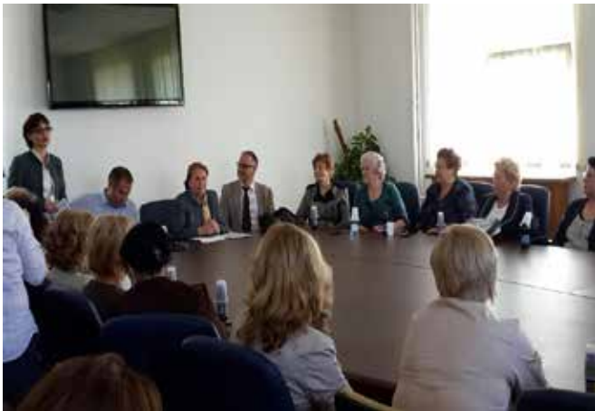
▪ Aktiviteti i realizuar nga ZBGJ në Prishtinë

Zyrtarja për Barazi Gjinore në Komunën e Skenderajt gjatë 2015 ka zhvilluar një varg aktivitetesh gjatë 2015, ku gjatë kësaj periudhe ka monitoruar shkollat fillore rreth rasteve të braktisjes së shkollës nga nxënësit, duke diskutuar me drejtoret e shkollave fillore dhe më familjaret e nxënësve që e kanë braktisur shkollën. Ku në mbështetje të Kuvendit Komunal të Skenderajt u është mundësuar vazhdimi i shkolimit dy vajzave njëra në kl. VIII-të dhe tjetra në kl. VI-të, në shkollën fillore në Turqefc.