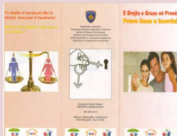
▪ Aktivitet i realizuar nga ZBGJ në MKK

Numri i përgjithshëm i të punësuarve në MI është 262, nga të cilët 195 ose 74,42% janë meshkuj, kurse 67 ose 25,58% janë femra.