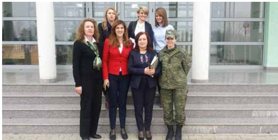
▪ Aktivitet i realizuar nga KJDNJ në MSFK

Zyrtarja për Barazi Gjinore në Ministrinë për Komunitete dhe Kthim gjatë këtij viti, ka organizuar aktivitetet me moton: “Ta njohim shëndetin tonë”, me ç’rast 28 punonjëse bënë EHO dhe Mamografinë e gjirit. Ky aktivitet u organizua për solidarizim, dhe përkrahje e grave të prekura nga kanceri i gjirit. Po ashtu janë përgatitur edhe dy broshura: “Stop Dhunës në Familje”, dhe “E Drejta e Gruas në Pronë”, në kudër të fushatës për ngritjen e vetëdijes dhe mirëqenies së shoqërisë sonë.