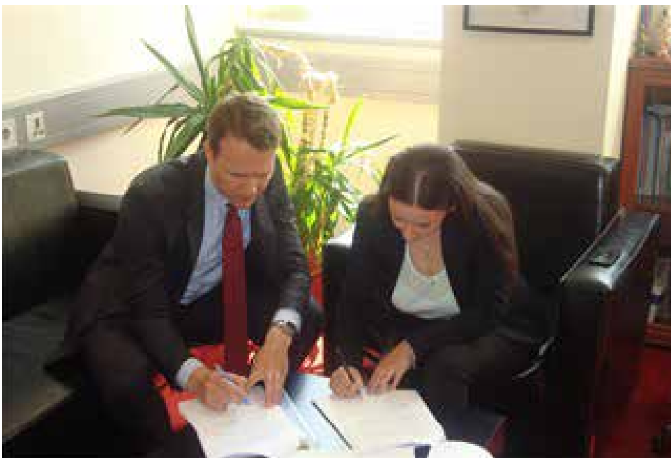
▪ Foto e realizuar nga nënshkrimi marrëveshjes me SIDA-n

Agjencia për Barazi Gjinore ka financuar pjesërisht projektin “Aktivitet psiko-sociale, edukativo shëndetësore dhe furnizim me inventar” të organizatës Autizmi Fletë. Projekti kishte synim tu mundësoj fëmijëve me autizëm aktivitete brenda qendrës, shëtitje në natyrë, kalërim në natyrë, shëtitje në parkun e Gërmisë si dhe furnizim me inventar. Pra, për ata fëmijë të krijohen kushte për një jetë të pavarur që të jenë pjesë aktive dhe e dobishme e shoqërisë.