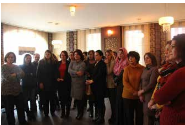
▪ Aktivitetet i realizuar nga ZBGJ në Pejë

Ndërkaq, për fushatën e 16 Ditëve të Aktivizimit është organizuar tryeze e rumbullakët me temë “Dhuna ndaj Gruas”. Tryeza kishte si qëllim sensibilizimin gjithëpërfshirës të opinionit në zbatimin e mekanizmave dhe parandalimin e dhunës në baza gjinore.