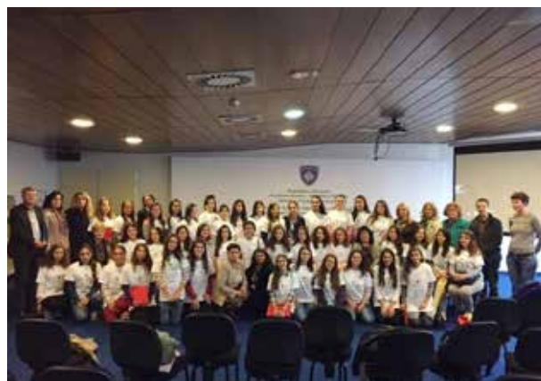
▪ Aktivitet i realizuar nga ZBGJ në MASHT

Me një angazhim të madh ZBGJ dhe përkrahje nga ministri dhe sekretarit të përgjithshëm është arritur që të mbahet punësoria një ditore me temë “Buxheti i Përgjegjshëm Gjinor” ku kanë qenë pjesëmarrës të gjithë drejtorët dhe udhëheqësit e departamenteve. MASHT-i është Ministria e parë që ka përgatitur një dokument të tillë për të shërbyer si shembull për të tjerët. Ky aktivitet është realizuar në mbështetje të RrGGK.