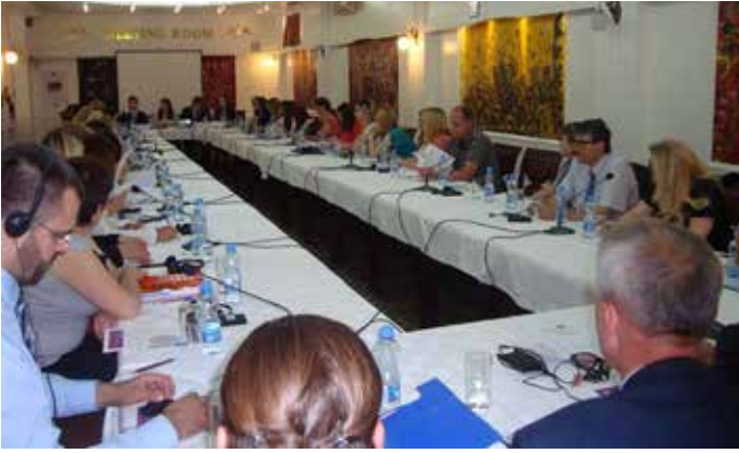
▪ Foto e nga punëtorja e Indeksit Gjinor