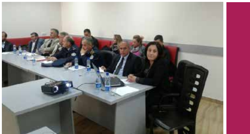
▪ Aktiviteti i realizuar nga ZBGJ në Dragash

Zyrtarja për Barazi Gjinore në Komunën e Dragashit ka mbajtur aktivitete të ndryshme bazuar në Planin Nacional të Veprimit për arritjen e Barazisë Gjinore por edhe në Planit lokal të Veprimit për Barazi Gjinore. Fillimisht shënimi i 8 Marsit, është realizuar bashkarish me gratë e institucioneve, me një vizitë grave punëtore, në fabrikën e koleksionit 'Invers One' - , në fshatin Shajen. Për ta shënuar këtë ditë është mbajtur edhe një mbledhje e Asamblesë komunale me tema çështja gjinore dhe në fund është shfaqur dokumentari "Unë ja dola! Mundesh edhe ti", mbështetur nga OSCE.