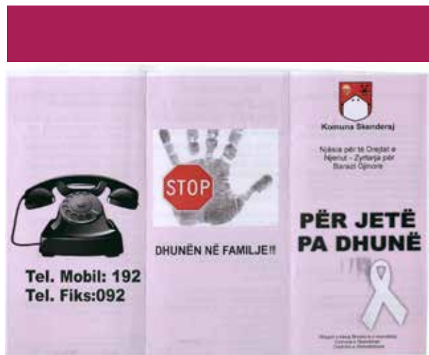
▪ Aktiviteti i realizuar nga ZBGJ në Skenderaj

Po ashtu janë përgatitur dhe shpërndara broshura me moton "Paqja në Botë, fillon me Paqen në Shtëpi".