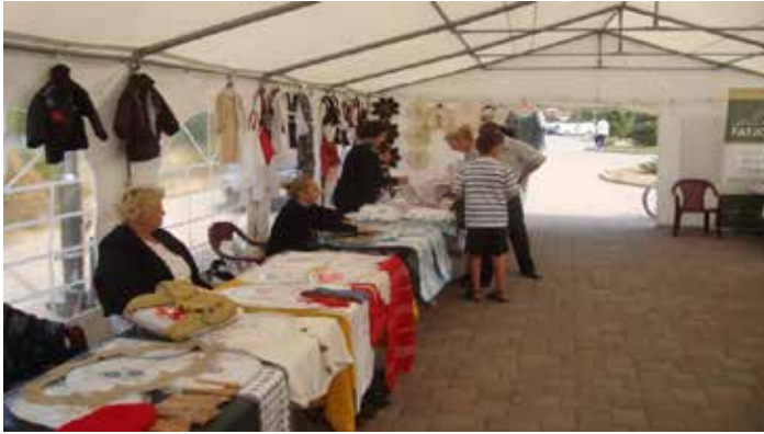
▪ Foto nga projekti: “Panairi i produkteve artizanale e ushqimore tradicionale të OJQ-së Bliri”

Agjencia për Barazi Gjinore ka financuar pjesërisht projektin “Aktivitet psiko-sociale, edukativo shëndetësore dhe furnizim me inventar” të organizatës Autizmi Fletë. Projekti kishte synim tu mundësoj fëmijëve me autizëm aktivitete brenda qendrës, shëtitje në natyrë, kalërim në natyrë, shëtitje në parkun e Gërmisë si dhe furnizim me inventar. Pra, për ata fëmijë të krijohen kushte për një jetë të pavarur që të jenë pjesë aktive dhe e dobishme e shoqërisë.