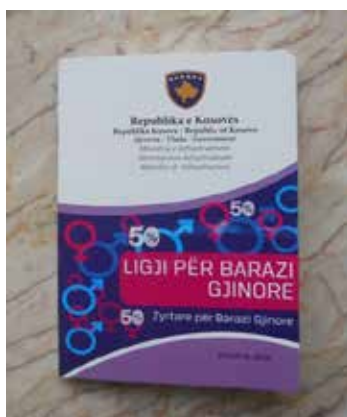
▪ Aktiviteti i realizuar nga ZBGJ në MI

Zyrtarja për Barazi Gjinore në Ministrinë e Administrimit dhe Pushtetit Lokal me rastin e hapjes së fushatës “16 Ditëve të Aktivizimit, Ditës Ndërkombëtare për Eliminimin e Dhunës ndaj Gruas”, ka organizuar tryezë të rumbullakët me zyrtarët e MAPL-së, ku gjatë tryezës u tha se të gjithë duhet të angazhohen për parandalimin e dhunës në familje dhe parandalimin e trafikimit me qenie njerëz në Republikën e Kosovës, për të gjithë pjesëmarrësit u shpërnda kordelja e bardhë. Po ashtu gjatë këtij vitit janë realizuar edhe dy fletëpalosje mbi të drejtën pronësore të gruas “ Si fitohet trashëgimia”, Kush janë trashëgimtarët ligjor”.